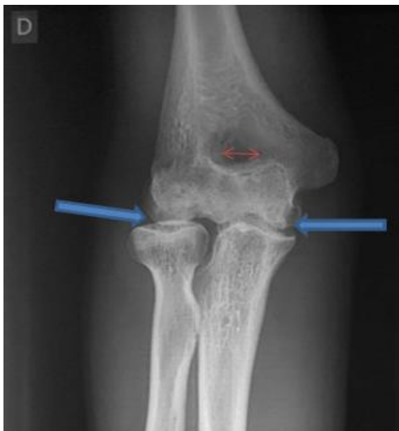
Figure 3. Un pincement diffus des deux compartiments articulaires (flèche bleue) et un élargissement de la fossette olécrânienne (flèche rouge).

A la biologie, on retrouvait un syndrome inflammatoire biologique non spécifique (anémie microcytaire hypochrome de 10,7 g/dL ; une