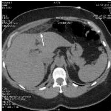
Figure 1. Scanner abdominal, coupe axiale sans injection objectivant une masse graisseuse sous pariétale de forme ovale « image en navette » adjacente au foie avec infiltration intra et péri lésionnelle. 361 × 361mm (72 × 72 DPI)

Le scanner abdominal réalisé sans et avec injection de produit de contraste iodé au temps portal a permis de conclure à l'appendagite aiguë (Figures 1-3).