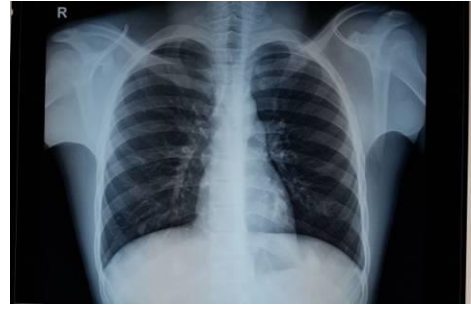
Figure 5. Radiographie du thorax (face) standard : Absence d'anomalie lésionnelle