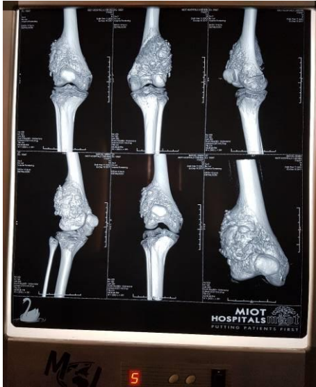
Figure 2. Reconstruction 3D du genou et l'extrémité distale du fémur mettant en évidence un processus tumoral avec un envahissement l'extrémité proximal du tibia