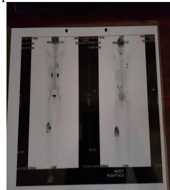
Figure 7. Scintigraphie du corps entier à l'Iode 135 montrant une hyperfixation à l'extrémité inférieure du fémur, la rotule et le tibia ainsi que pulmonaire.

En définitif, ce patient de 14 ans a présenté un ostéosarcome du fémur droit avec métastases pulmonaires (stade 4) ayant bénéficié d'une prise en charge multidisciplinaire en milieu mieux équipé. En Inde, la kinésithérapie associée à la chimiothérapie a amélioré la qualité de vie du patient en levant l'impotence fonctionnelle. Après 6 mois de prise en charge en Inde, le patient est rentré à Kinshasa, marchant normalement sans appui ni boiterie ; avec un gain pondéral de 13 kg (38 kg à 51 kg). Le patient sera perdu de vue pendant près de 18 mois. En effet, le patient avait en réalité interrompu la chimiothérapie au profit d'une médecine alternative (de nature ignorée) avec