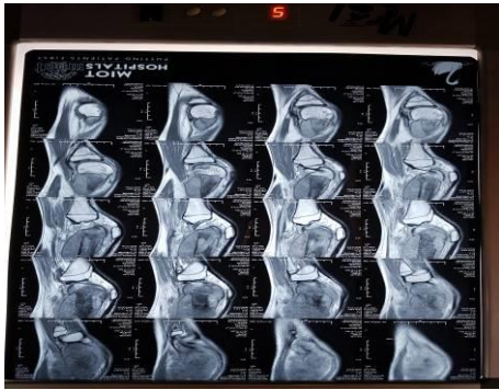
Figure 3. IRM séquentielle du genou droit mettant en évidence un processus tumoral sur l'épiphyse distale du fémur avec une tendance à l'envahissement des structures avoisinantes