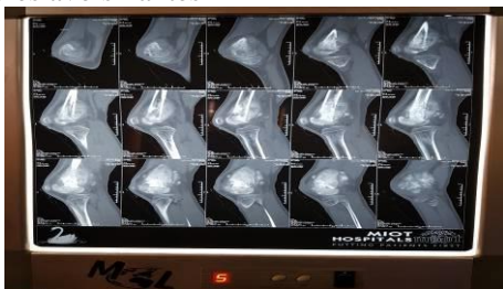
Figure 4. IRM Séquentielle du genou droit mettant en évidence un processus tumoral, localisé à l'extrémité distal du fémur avec une tendance à l'envahissement de l'extrémité proximal du tibia