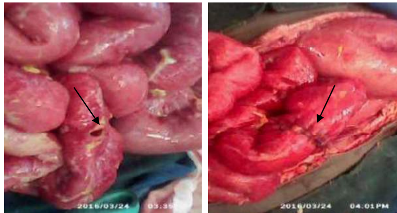
Figure 1. Illustration d'une perforation et une suture extra muqueuse extériorisée réalisée (flèche noire)

Toutes les sutures réalisées étaient extra muqueuses extériorisées (points allant de la séreuse à la sous-muqueuse et revenant de la sous-muqueuse à la séreuse) (figure 1). Ces sutures étaient pratiquées après une toilette abdominale et un nettoyage abondant avec au moins 3 litres de solution physiologique.