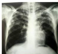
Figure 3. Opacités réticulaires des tiers supérieurs des poumons

Les lésions étaient bilatérales dans un peu plus d'un cas sur deux (n=34 ; 54,8%), localisées au poumon droit dans 17 cas (27,5%), au poumon gauche dans 11 cas (17,7%). En fonction des syndromes radiologiques décrits, les opacités alvéolaires étaient plus fréquemment et de prédominance dans le poumon droit (55,6% des cas) ; tandis que les formes réticulaires (62,5%) et réticulo-nodulaires (64,3%) étaient en majorité bilatérales.