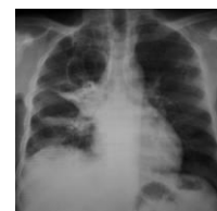
Figure 1. Syndrome cavitairé du tiers supérieur du poumon droit

Les lésions radiographiques décrites étaient en ordre décroissant : les opacités alvéolaires (18 cas ; 29%), les atteintes interstitielles de type réticulaire (16 cas ; 25,8%), les opacités réticulo-nodulaires (14 cas ; 22,6%), et enfin le syndrome cavitairé (13 cas ; 21%). Les opacités micro-nodulaires diffuses ou miliaire ont été observées chez 7 patients (11,3%). Les syndromes alvéolaire (Figure 1) et cavitairé (Figure 2) étaient plus observés chez les patients avec une bacilloscopie positive, et plus fréquemment chez ceux âgés de moins de 60 ans. Les opacités réticulo-nodulaires quant à elles, étaient plus observées en situation de bacilloscopie négative (tableau 1).