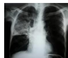
Figure 2. Opacité alvéolaire avec bronchogramme aérien, intéressant les 2/3 supérieurs du poumon droit